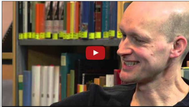
Leselounge mit Literatur- und Medienstars