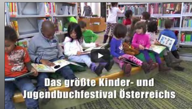
LESERstimmen – Der Preis der jungen LeserInnen