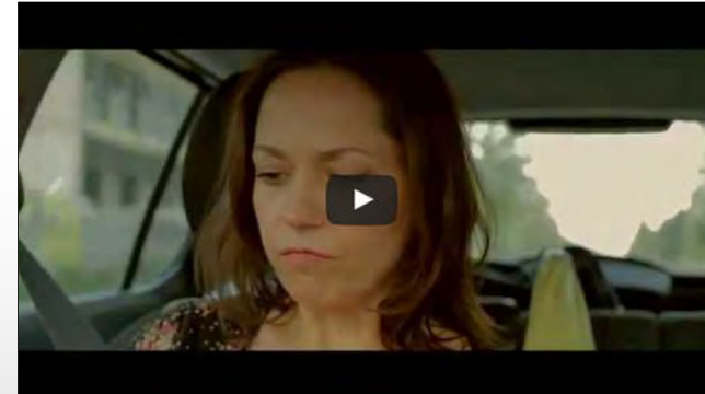
Imagefilm „Lesen und lesen lassen“